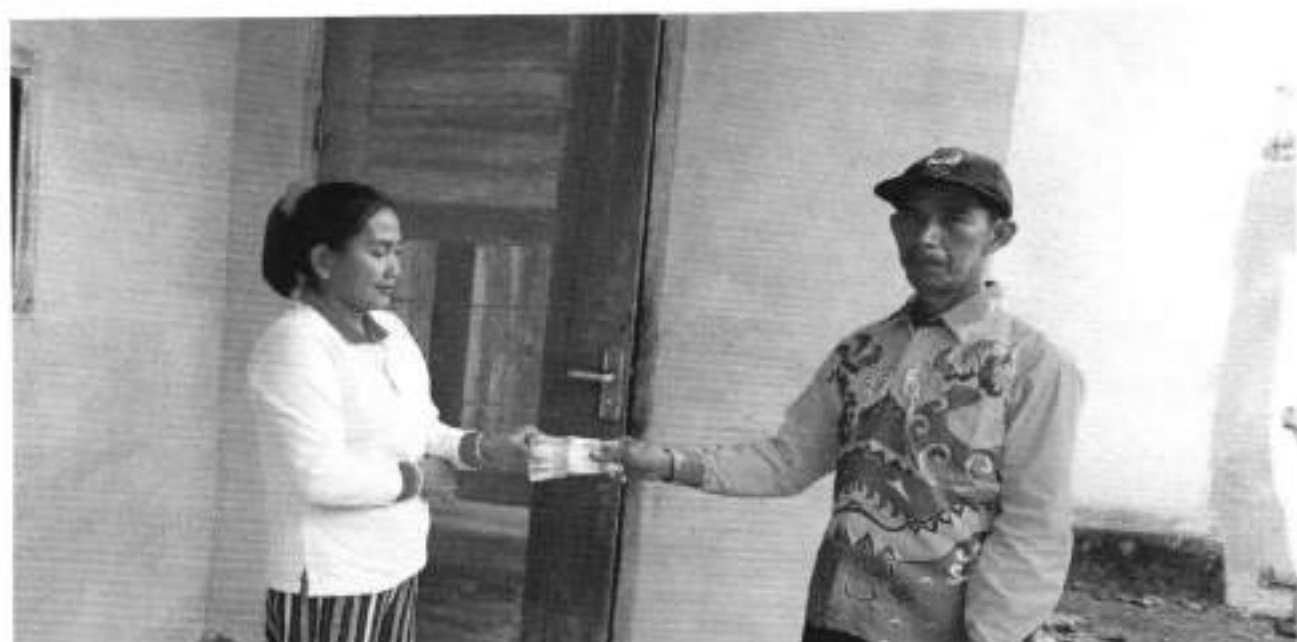
PENYALURAN OPERASIONAL RDS