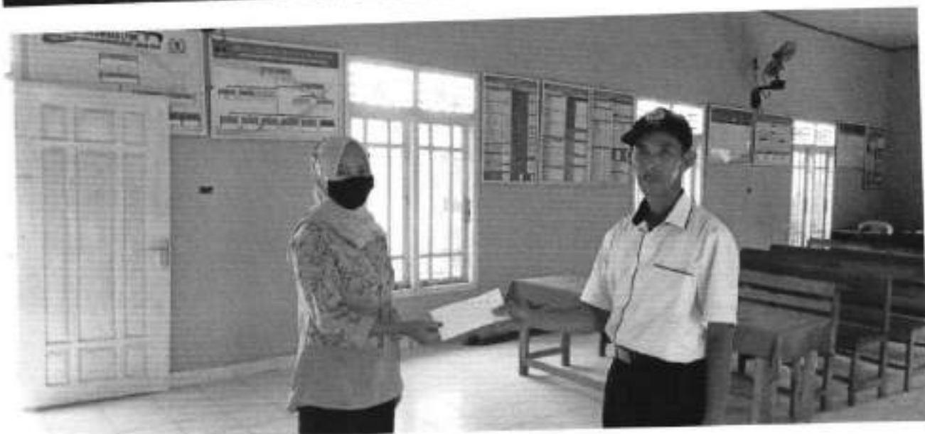
KEGIATAN PELAKSANAAN KADER KPM