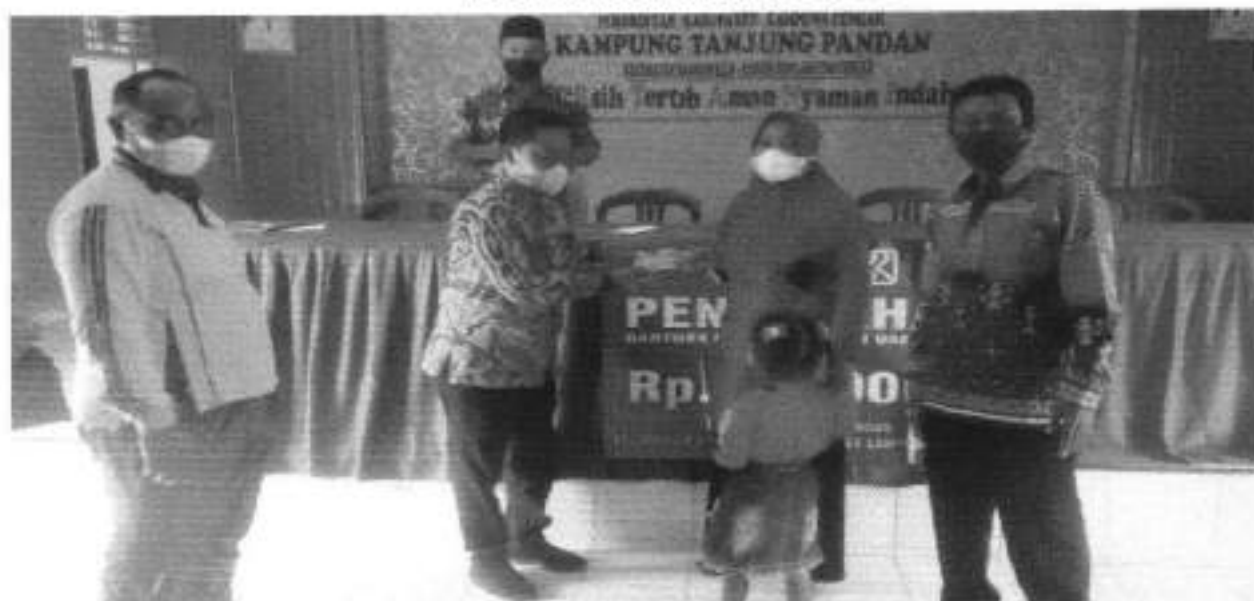
FOTO PENYALURAN BLT DD