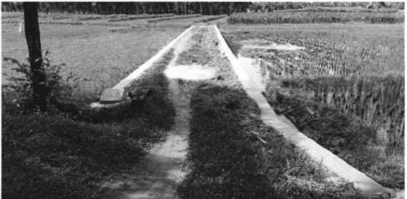
PEMBANGUNAN TPT DUSUN 1.A