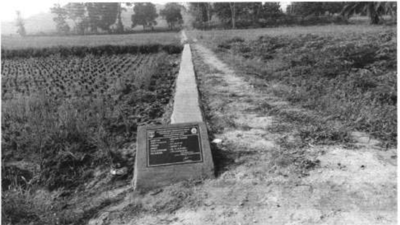
PEMBANGUNAN TPT JUT DUSUN 1.A