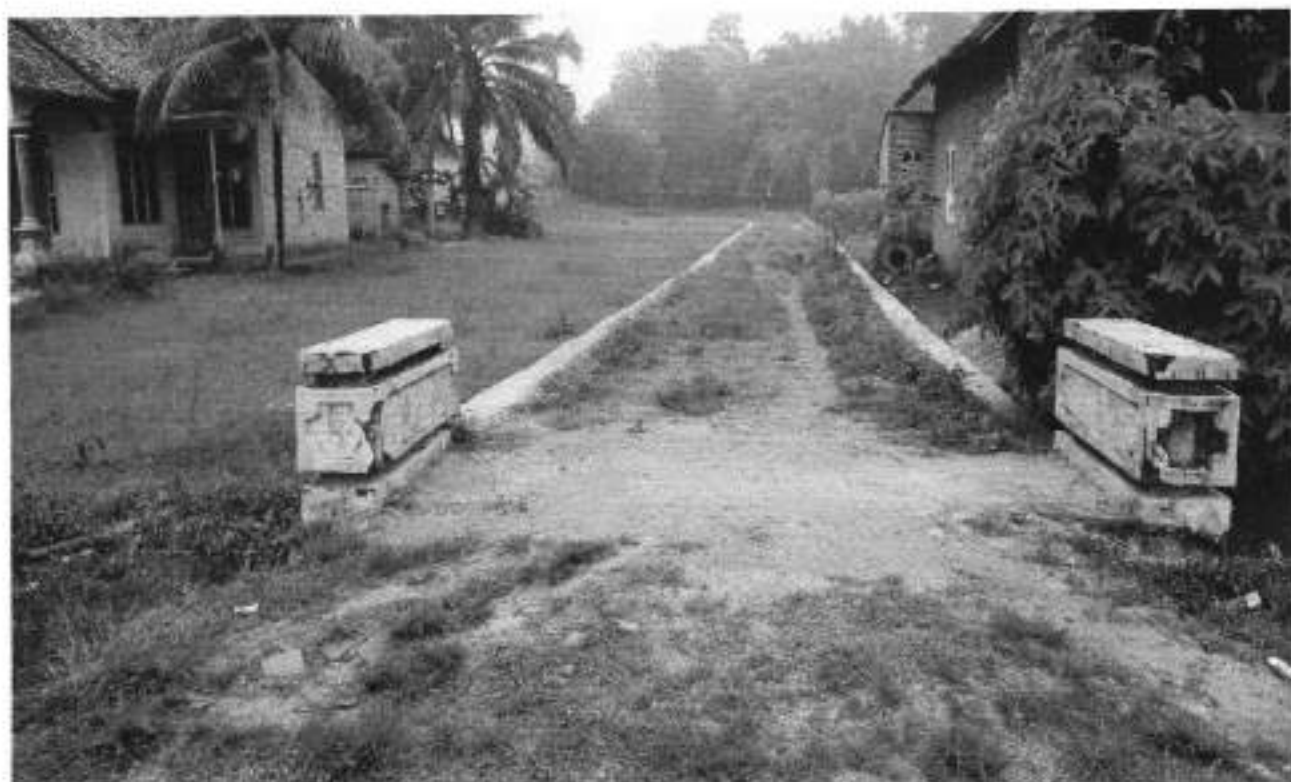
PEMBANGUNAN TPT JUT 0,60 X 20 M DUSUN 1.A